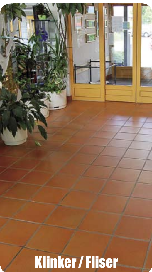
Klinker / Fliser