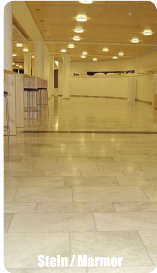
Stein / Marmor

En stor fordel med PLS I-VAX system er at det er en og samme metode for den daglige rengjøringen samme hva slags gulvmateriell som skal rengjøres. Det er veldig sjeldent at det bare er en gulvtype i et rengjøringsobjekt.