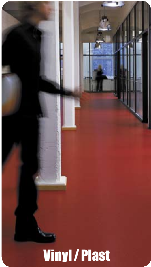
Vinyl / Plast